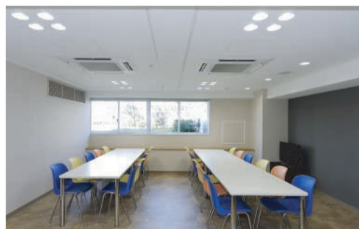
各階キッチンラウンジで世界各国の料理が楽しめる?