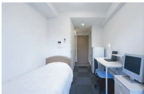
居室には生活必需品が完備