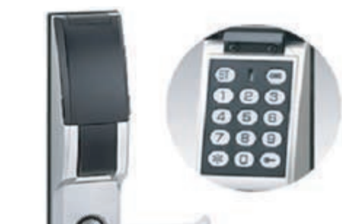
各部屋には防犯性の高い暗証番号式デジタルロック