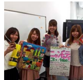
ミタイ基金学生グループ横国で発足