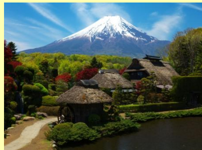
世界文化遺産 富士山と忍野八海 Oshino Hakkai, Water springs of Mt. Fuji