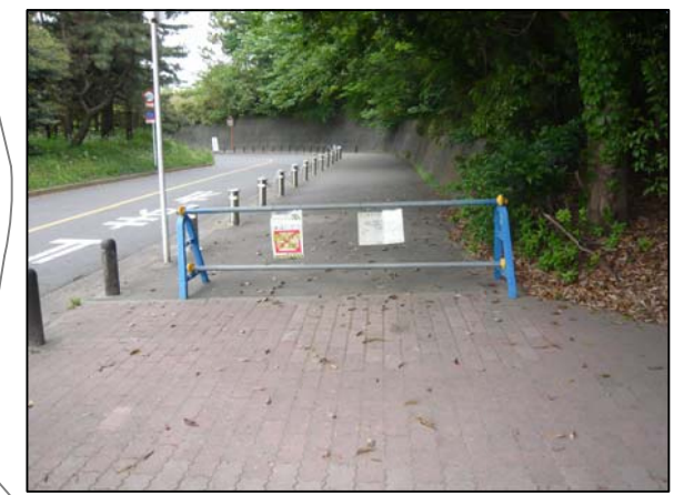
単管バリケードイメージ図