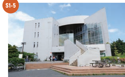
S1-5 大学会館・大学生協 生協売店(1F) 10:00~17:00