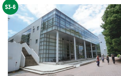
S3-6 中央図書館 図書館サービス shoca.(1F) 8:40~21:45 11:00~16:00

※開館・営業時間は授業期間の平日 ※各食堂・売店の営業時間については変更があり得ますので、横浜国立大学生協ウェブサイトを確認して下さい。