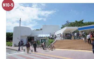
N10-5 第2食堂・大学生協 第2食堂 11:00~14:30, 17:30~19:30 生協売店(2F) 10:00~15:00