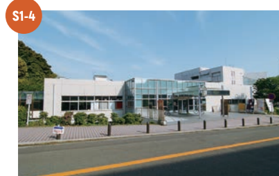
S1-4 第1食堂(シェルスユ) 第1食堂(シェルスユ) 11:00~14:30