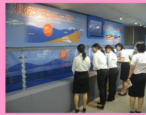
施設等見学 (気象庁)