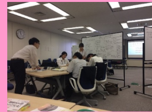
政策の企画・立案プロセス等体験 (原子力規制庁)