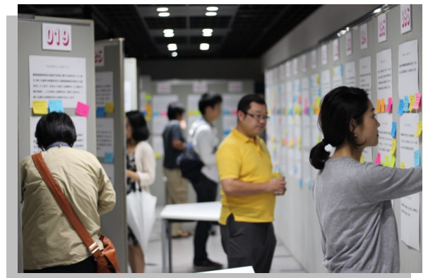
参考:「京大100人論文」の様子