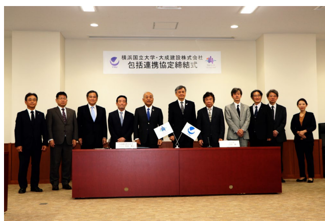
・出席者全員での記念撮影