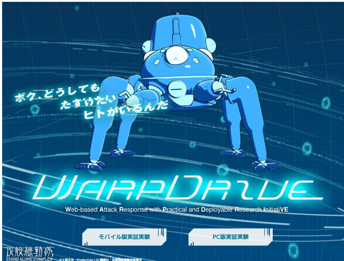
図 1 WarpDrive ポータルサイト ( https://warpdrive-project.jp )

⇒タッチコマ・モバイルのダウンロード ( https://warpdrive-project.jp/mobile-app/ )