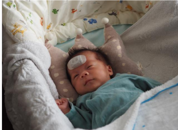
図3 デバイスを装着した新生児