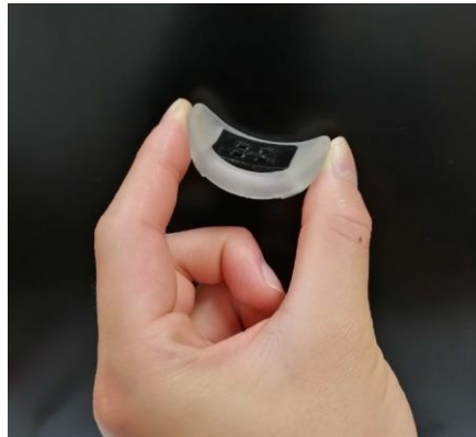
図1 新生児用ウェアラブル型マルチバイタル計測デバイス

本研究グループは、脈拍、 \text{SpO}_2 、経皮ビリルビン値が計測できる大きさ縦3cm×横5cm、16グラムの新生児向けのウェアラブルセンサを開発しました（図1）。今後はさらに心電、呼吸などの他のバイタルサインの計測と連動して、新生児の様々なバイタルサインを包括的に計測できるウェアラブルセンサを開発して行く予定です。これらをセンシングできる安定的なデバイスを実現することで、在宅で両親が安心して新生児・小児を看護できる環境や在宅医療への更なる展開を期待することができます。