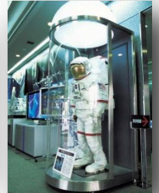
筑波宇宙センター Tsukuba Space Center