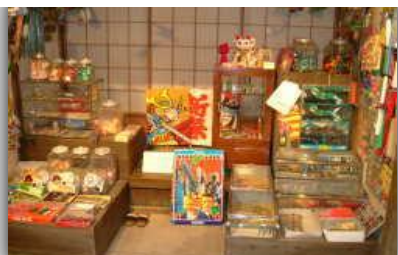
筑波山神社 Tsukuba Mt. Shrine お菓子博物館 Sweets Museum