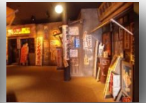
国立歴史民俗博物館 National Museum of Japanese History