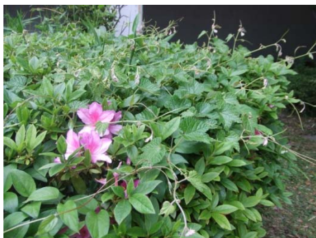
ツタに覆われたツツジ