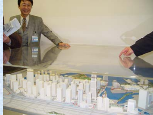
17) みなとみらい21地区の模型で全体を把握

午後からは国土交通省が所有する監督測量船「たかしま」に乗船し、横浜港の概要についての説明を聞き、海から港を視察しました。普通は見ることのないベイブリッジを真下から見上げた時には、思わず歓声があがっていました。また、午前中に説明を受けたみなとみらい21地区を海上から眺めたりと、楽しい時間を過ごしました。