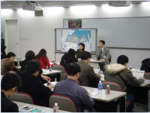
16) みなとみらい21地区の都市計画について説明を聞く一行