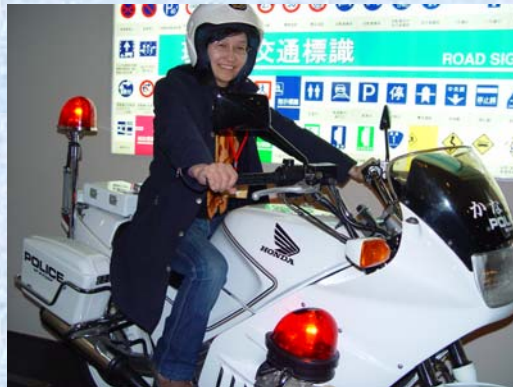
19) 警察の制服の変遷、白バイにもまたがって婦人警官を気取って