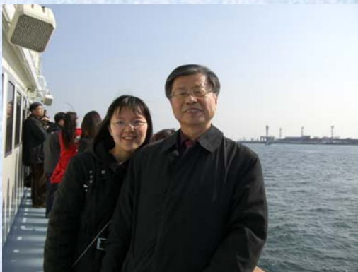
18) 船の上ではみんなの笑顔と歓声がこぼれました。青空の下気持ちがいい～！